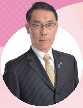
大野 元裕 埼玉県知事